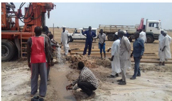
Een waterbron wordt aangelegd in Noord-Darfur (Soedan).