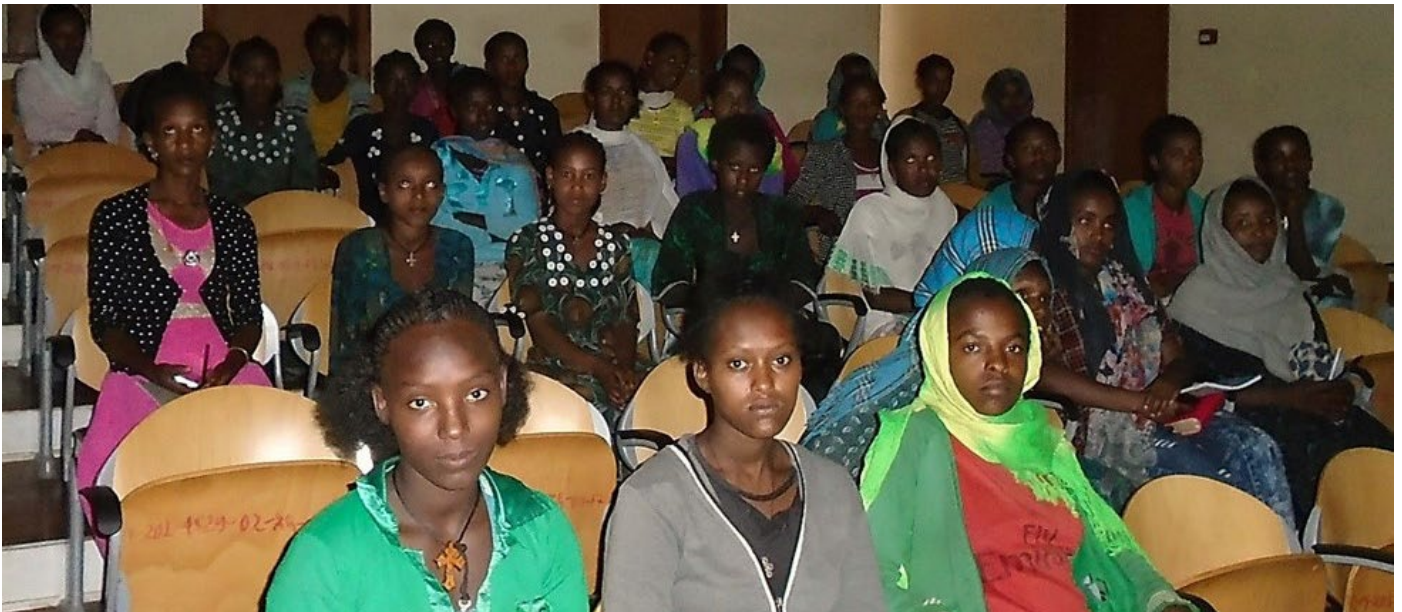
Meisjes in Ethiopië die zijn behoeft voor een kindhuwelijk.