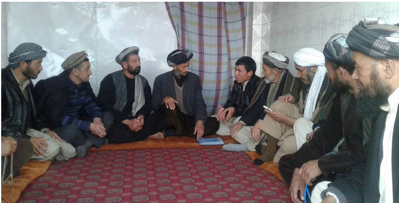
Dialogo met religieuze en traditionele leiders in Afghanistan over de vrijheid van meningsuiting van vrouwen (het dorp Qoriq in het district Charkent, februari 2017).