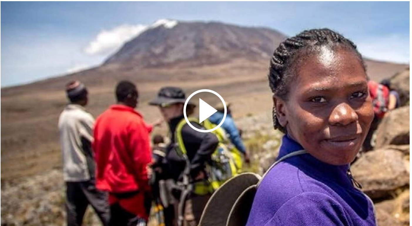
De campagne #Women2kilimanjaro om draagvlak te creëren voor nieuwe wetten waardoor ook vrouwen land kunnen bezitten.