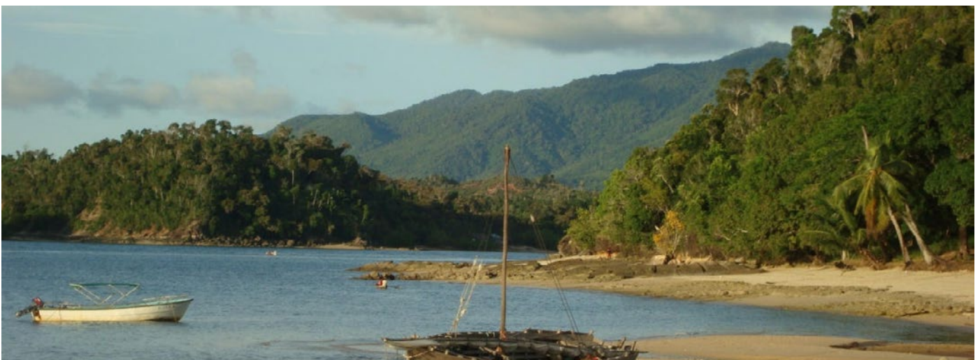
Een inclusieve dialoog over de ontwikkeling van een natuurgebied in Madagaskar.