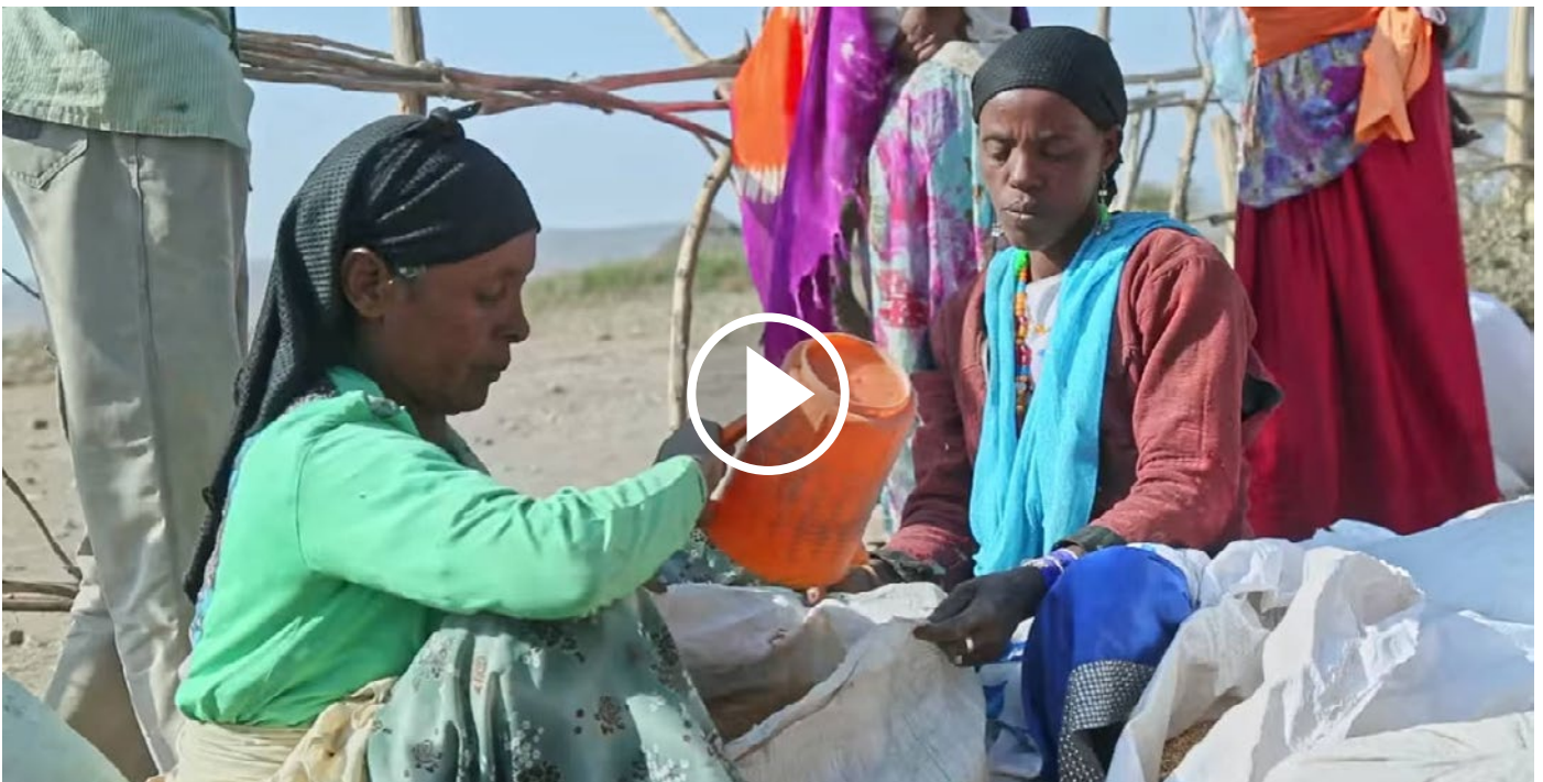
Ethiopië: de kloof tussen humanitaire hulp en ontwikkelingssamenwerking voorbij