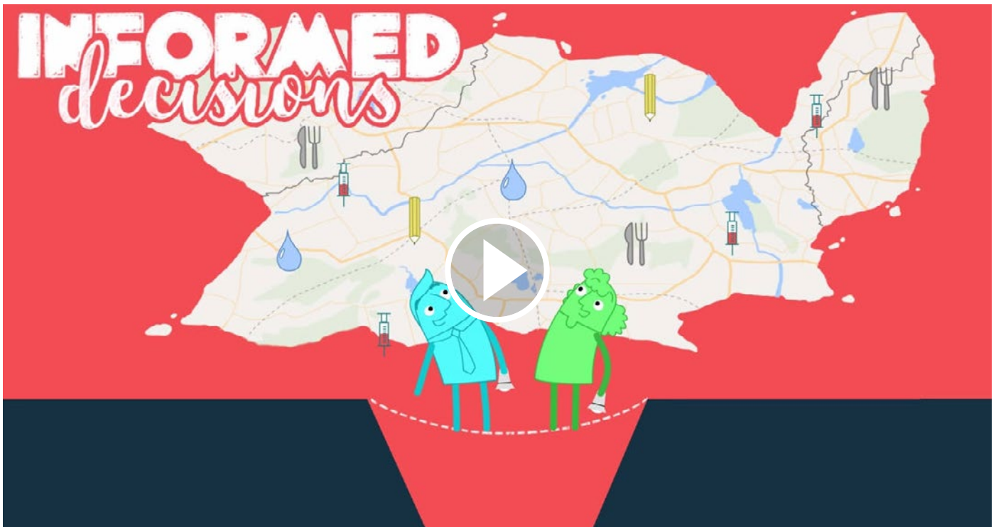
Wat is het International Aid Transparency Initiative? (IATI Videos)