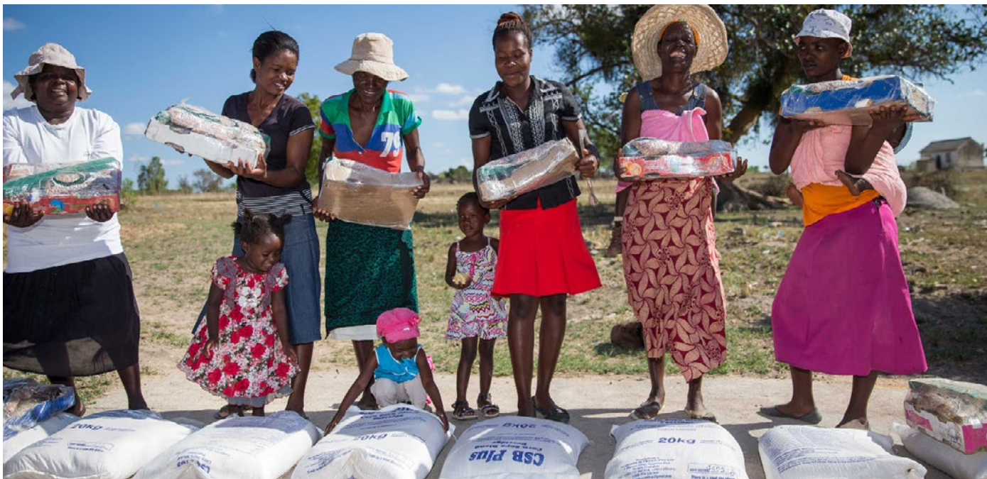
Voedselverstreking door de Dutch Relief Alliance in het door droogte getroffen Zimbabwe. Zwangere vrouwen en jonge moeders ontvangen voedselpakketten in het Zvamabande ziekenhuis in Zimbabwe.