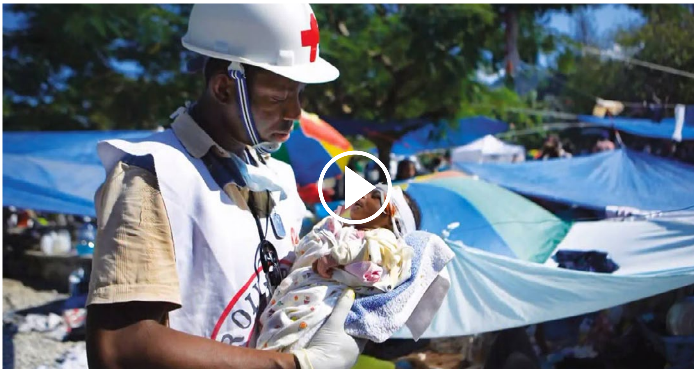
Crisisparaatheid (Het Nederlandse Rode Kruis)