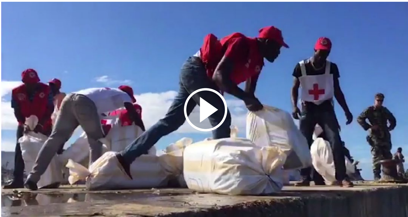
Respons bij orkaan Matthew in Haïti (het Rode Kruis/de Rode Halve Maan)