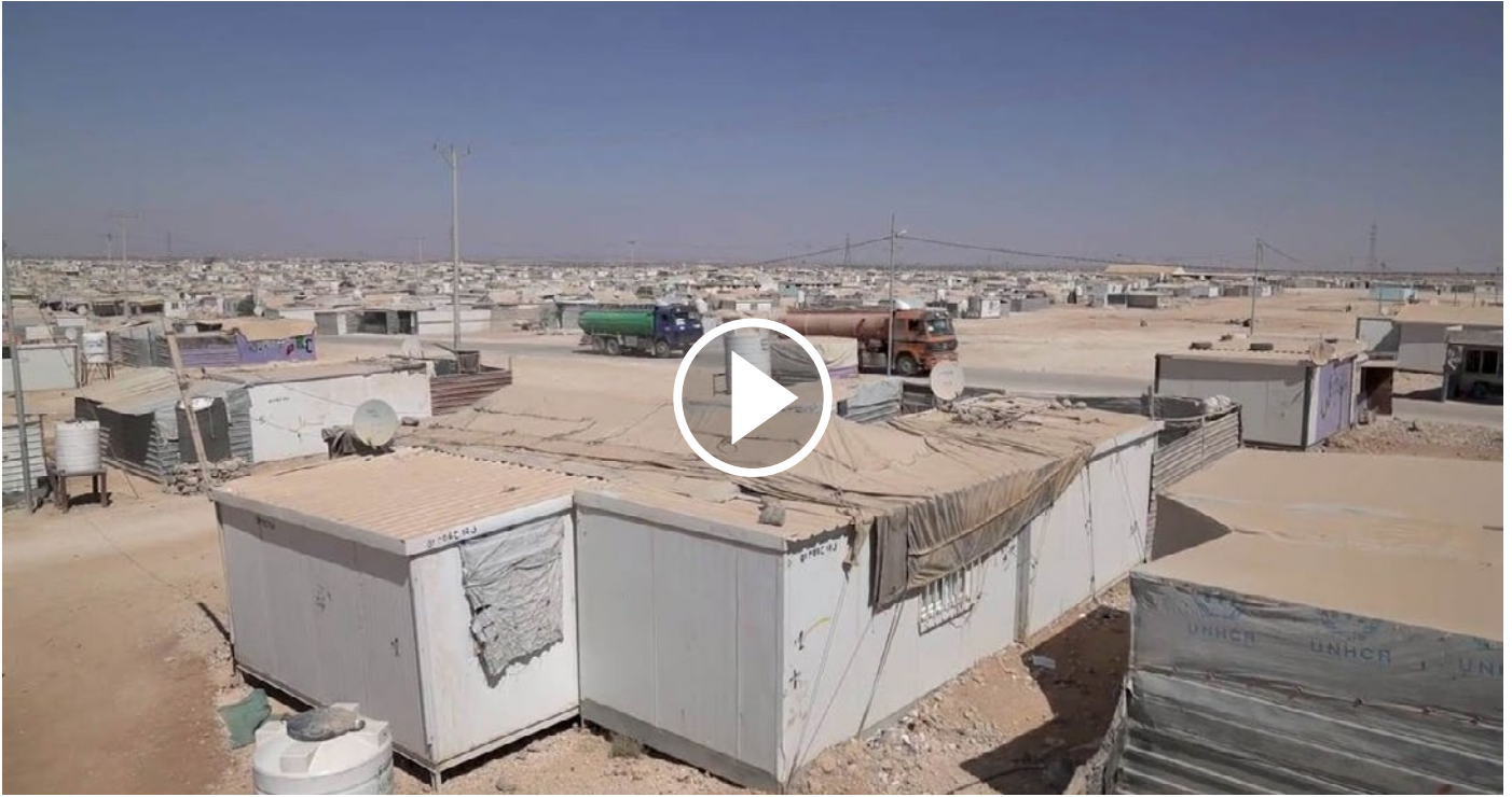
Verbeterd beheer van de afvoer van afvalwater uit het vluchtelingenkamp Za'atari (UNICEF & VN Global Pulse)